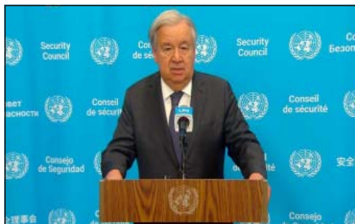
El Secretario General, António Guterres, comparece ante los periodistas por la situación en Oriente Medio.

Ante el avance de la impunidad en Oriente Medio, el Secretario General de la ONU advierte que el desprecio por las normas internacionales tiene consecuencias devastadoras: caos, sufrimiento y destrucción. En un mensaje claro, afirma que el derecho internacional no es opcional y que la única salida a la crisis pasa por la diplomacia, no por la escalada militar. El Secretario General de la ONU, António Guterres, lanzó este martes una advertencia sobre el progresivo abandono del derecho internacional en Oriente Medio, en una rueda de prensa en Nueva York. "La justicia está destinada a ser ciega. Pero hoy, demasiados están eligiendo hacer la vista gorda ante la justicia misma", declaró. Guterres denunció que las normas que rigen el uso de la fuerza y la conducta de las hostilidades son ignoradas, los civiles sufren daños intolerables, las obligaciones humanitarias se desatienden y hasta se violan las protecciones de las Naciones Unidas y su personal. "La ilegalidad genera caos. La ilegalidad alimenta el sufrimiento. La ilegalidad conduce a la destrucción", subrayó.